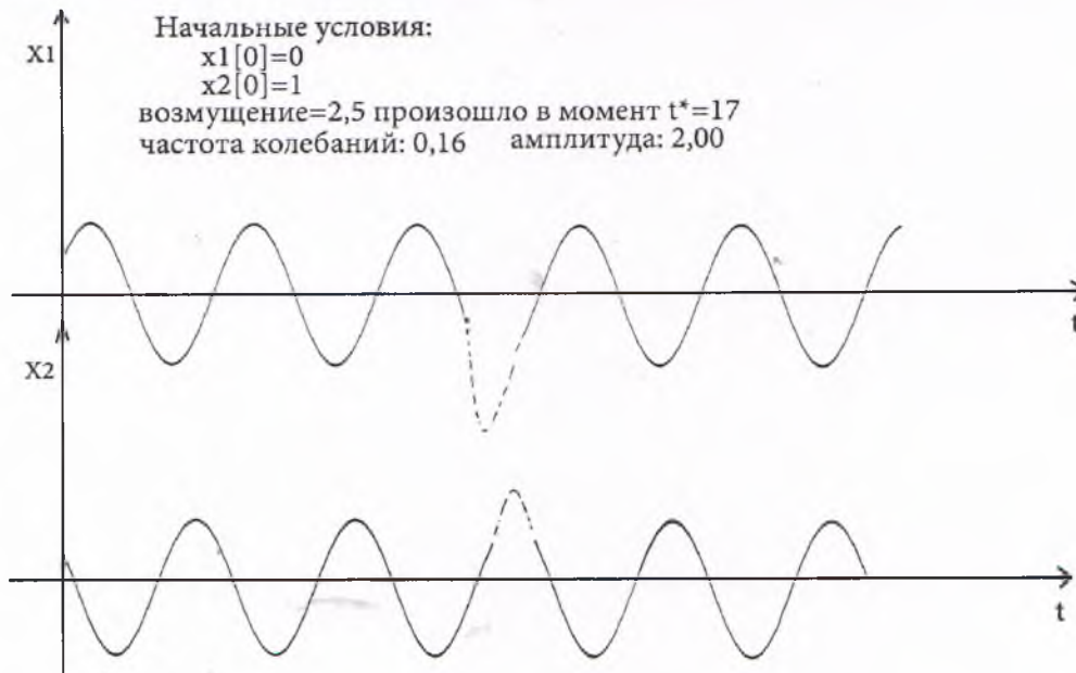
Рис. 1. Предписанные движения со стабилизацией